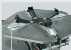
G800A98 → 20"-22" (4 x kit)