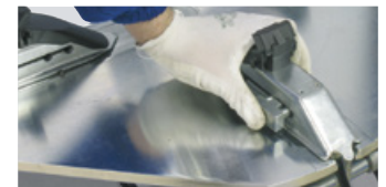
10" -24" (2 position)