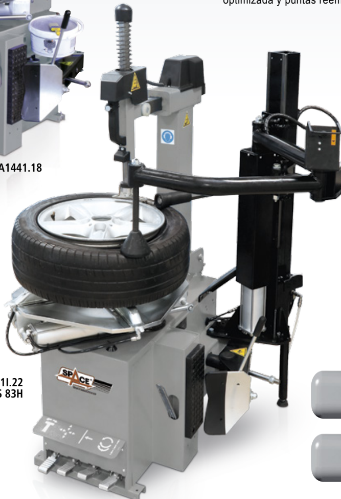
GA2441.22 + PLUS 83H