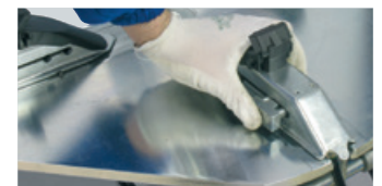
10" - 24" (2 position)