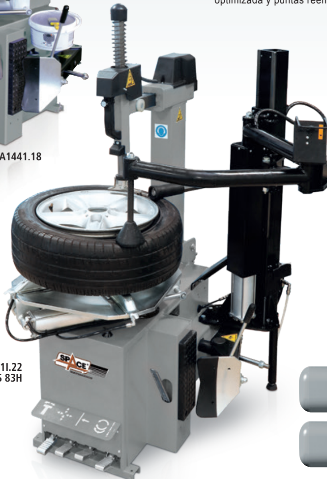
GA2441.22 + PLUS 83H